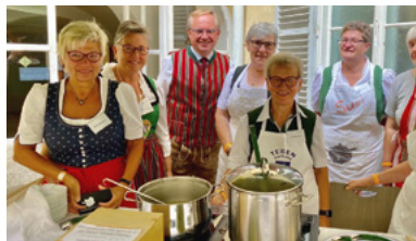
Beim „Aufsteirern“ in Graz wurden schmackhafte Suppen kredenzt – auch in der To-go-Variante.