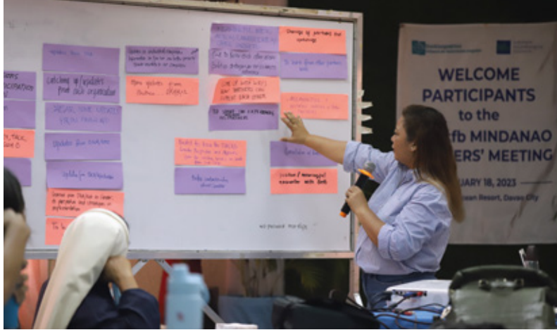
Beim „DKA/kfb Mindanao Partners' Meeting“ wurde ein „Safe Space“ für Teilnehmer*innen geschaffen.

Auf dem Programm stand neben der Möglichkeit zum persönlichen Kennenlernen auch der gegenseitige Wissensaustausch.