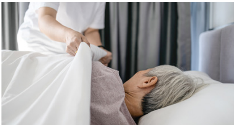
Der Kreislauf der globalen Sorge-Wanderarbeiter hat Folgen.