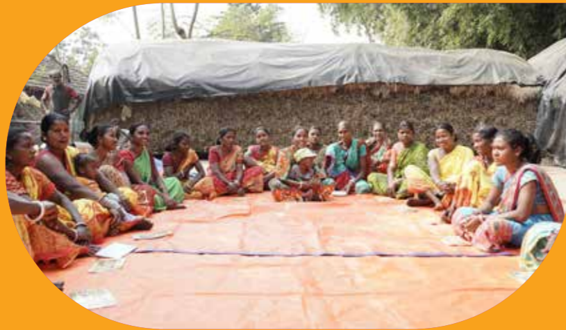
Seit sich SEEDS in den Adivasi-Dörfern engagiert, werden die Frauen mit ihren Anliegen ernst genommen und partizipieren bei allen wichtigen Entscheidungen.

Bedingungen, die Partizipation ermöglichen, müssen aktiv geschaffen und Strukturen verändert werden. Die Mehrheitsgesellschaft darf dazulernen und umdenken. Unbezahlte Fürsorgearbeit soll fair zwischen den Geschlechtern geteilt, gleicher Lohn für gleiche Arbeit bezahlt werden. Frauen und Minderheiten sollen auf allen gesellschaftspolitischen Ebenen sichtbar werden und Zugang zu Führungspositionen bekommen. Zentral für Teilhabe ist auch Bildung: Wer von ihr ausgeschlossen bleibt, kennt seine Rechte nicht und kann diese nicht verteidigen.